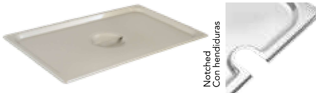
Notched Con hendiduras